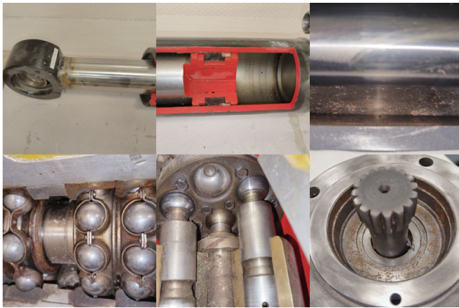
Рис. 3. Примеры деталей гидравлического привода, подверженных коррозионному износу

Химическая коррозия в жидких неэлектролитах свойственна для деталей, узлов и агрегатов гидравлического привода лесной техники, например, гидронасосов, гидромоторов, силовых цилиндров, фитингов и др. (рис. 3). Причиной возникновения коррозионного разрушения является взаимодействие гидравлического масла с деталями гидроагрегатов, причем особенно интенсивно коррозионные процессы протекают при высокой температуре и давлении [Радиминович и др., 2025].