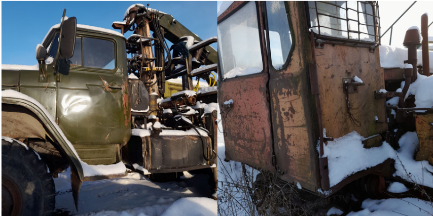
Рис. 4. Лесовозный автомобиль Урал 4320 и трелевочный трактор ТДТ-55 со следами атмосферной коррозии, полученными в результате износа лакокрасочного покрытия (техника ООО «Вольнов»)

В процессе взаимодействия лесных машин с предметом труда, осуществления технологических переездов под пологом леса и пр. происходит постепенное изнашивание лакокрасочных покрытий наружных элементов конструкции машин, в частности, кабин операторов техники. В результате появляются участки металла, которые лишены защиты от воздействия влаги и постепенно подвергаются коррозионному разрушению (рис. 4).