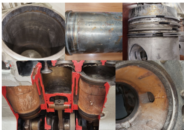
Рис. 2. Примеры деталей цилиндра-поршневой группы, подверженных коррозионному износу