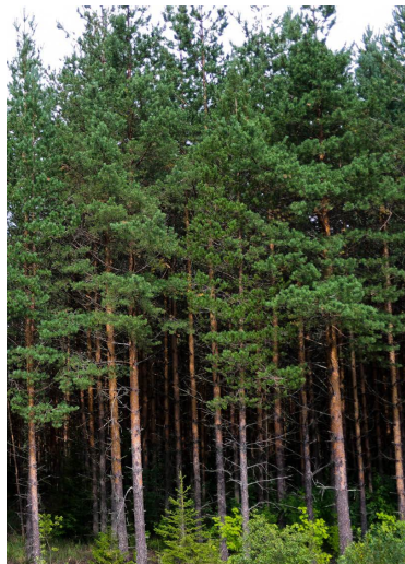
Рис. 1. Пример насаждения, полученного путем двухрядной посадки саженцев

прогнозных характеристик древостоя, оставляемого на дорастивание после изреживания [Романов и др., 2012; Антонов, 2017; Большаков и др., 2019; Дебков, 2020; Гамсахурдия, 2022; Rukomojnikov et al., 2023].